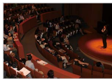
昨年の開催の様子