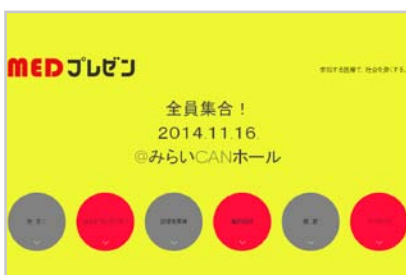
MED プレゼン 2014 ホームページ